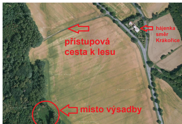
Mapka lokality výsadby