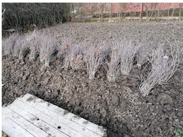
Nakoupené sazenice dubu letního

S sebou si vezměte rýč (případně sázečku) a pracovní rukavice. Kdo má ruce a nohy, neváhejte a přijďte. Můžete se těšit na pocit dobře odvedené práce, zdravý pobyt na čerstvém vzduchu a drobné občerstvení, které zajistí obec. Akce je určena pro všechny dobrovolníky od tří do sta let 😊. Předem všem děkujeme za účast!