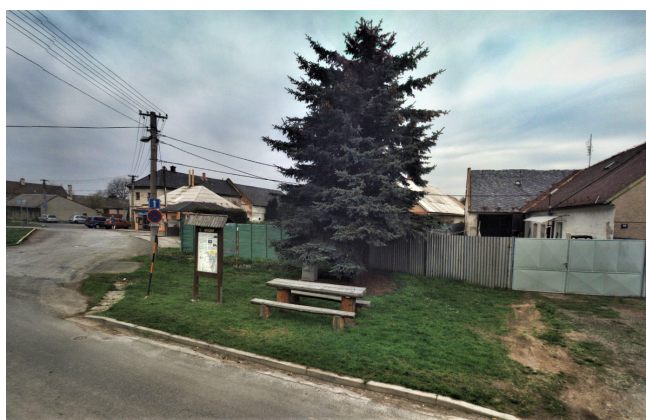
Stávající podoba prostranství naproti obchodu

Tato dotace by měla pokrýt zakoupení zastřešeného posezení, výstavbu jednotného plotu za „vánočním“ stromem a celkovou úpravu tohoto prostranství. Po dokončení pak bude místo sloužit k setkávání našich občanů, k posezení a občerstvení turistů a cyklistů směřujících do lesů Nízkého Jeseníku. Pokud vše vyjde, proběhla by celá akce ještě letos, zřejmě formou obecní brigády, neboť výše dotace ve výši 150 000 – 200 000 Kč zcela jistě nepokryje náklady spojené s řešením „na klíč“. O podrobnostech vás budeme samozřejmě informovat v příštích číslech zpravodaje.